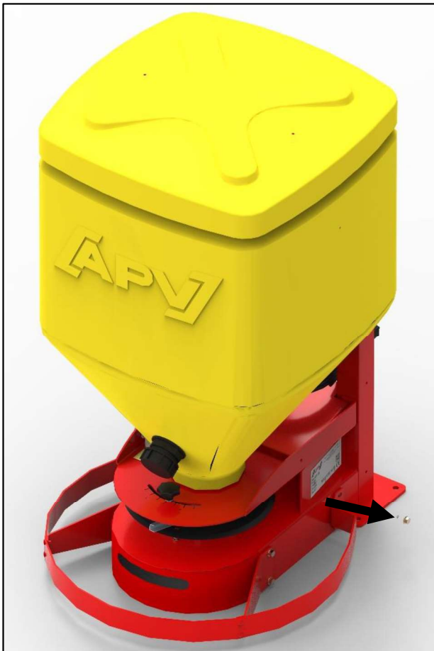
Abbildung 1: Entfernen der Sechskantschrauben

Dazu lösen Sie die 8 Sechskantschrauben (Schlüsselweite 10) und nehmen den Schutzbügel ab, wie in Abbildung 1 und Abbildung 2 ersichtlich.