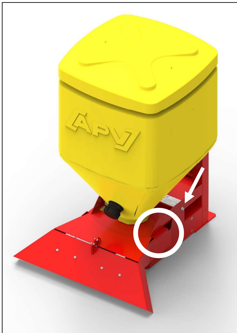
Abbildung 3: Montage der Präzisionsstreuplatte

Montieren Sie die Präzisionsstreuplatte an einem ES 100 Special M3 oder einem MD (Multidosierer), so sind an den Streuern noch keine Schrauben vormontiert, es sind lediglich die Löcher am Rahmen vorgebohrt. Hier benötigen Sie somit die beiden Sechskantschrauben des Lieferumfangs der Präzisionsstreuplatte.