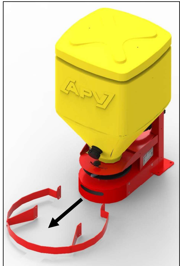
Abbildung 2: Abnahme des Schutzbügels